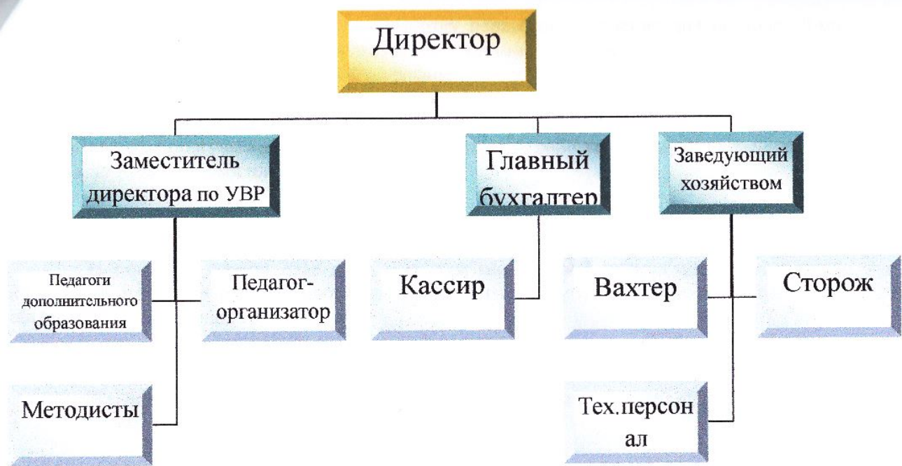
рис.2. Система управления МБУ ДО «СЮТ»

Таким образом, в целом сложившаяся система управления и структура станции юных техников достаточны для обеспечения выполнения функций МБУ ДО «СЮТ» в сфере дополнительного образования в соответствии с действующим законодательством Российской Федерации. Имеющаяся система взаимодействия обеспечивает жизнедеятельность станции юных техников, позволяет успешно вести образовательную деятельность в области технического творчества, обеспечивает выполнение поставленных целей и задач и в целом соответствует современным требованиям.